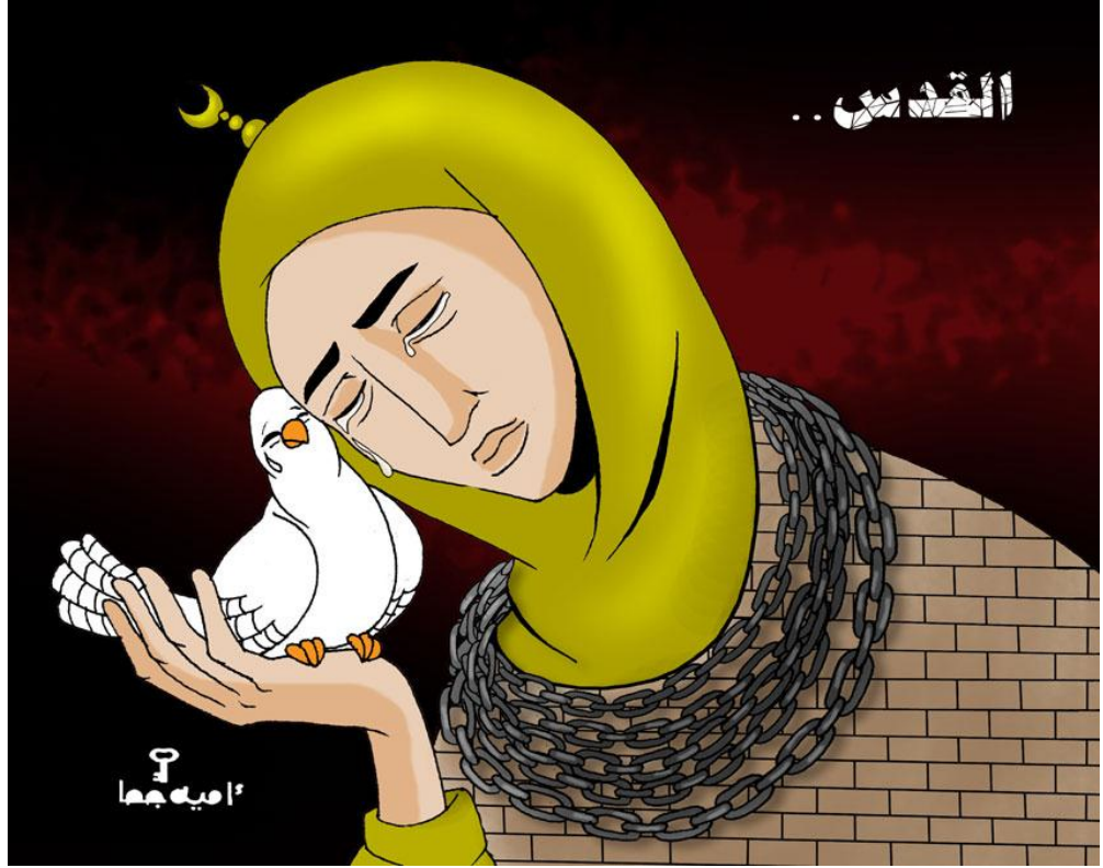
الراية، الدوحة، 2012/6/12