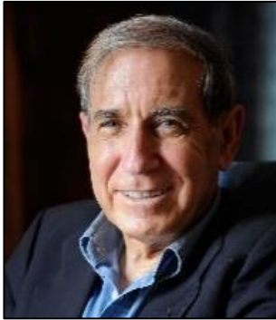
شلومو بن عامي

غير أن العلاقات الإسرائيلية القطرية توترت بعد اندلاع انتفاضة الأقصى الفلسطينية في أيلول/ سبتمبر 2000، على الرغم من أن الدوحة ظلت مترددة في قطع جميع العلاقات مع "إسرائيل"،