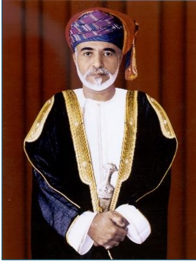
قابوس بن سعيد

ظلّ العمانيون، من جانبهم، حريصين على التأكيد على أن زيارة ننتياهو لا تشكّل خروجاً جذرياً عن دعمهم لقيام دولة فلسطينية. خصوصاً وأن الزيارة قد أثارت استياءً في أوساط عديدة، شعرت بأن النفوذ الإسرائيلي المتزايد في عواصم الخليج جاء على حساب الفلسطينيين. وقد سارع