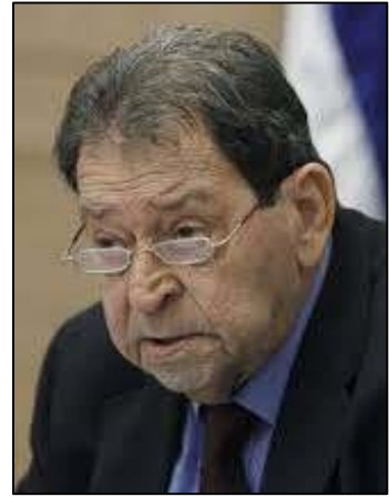
بنيامين بن أليعازر

ويبدو أن هذا الاستثمار الدبلوماسي آتى أكله فيما بعد؛ ففي سنة 2010 زار وزير الصناعة والتجارة والعمل الإسرائيلي الأسبق بنيامين بن أليعازر Benjamin Ben Eliezer الدوحة، وبعد زيارته بوقت قصير، عرضت قطر تطوير علاقاتها الدبلوماسية مع "إسرائيل"، بشرط أن يسمح للدوحة بأن تقوم بعملية إعادة إعمار واسعة النطاق في غزة؛ الأمر الذي رفضه كل من رئيس الوزراء الإسرائيلي بنيامين نتيناهو ووزير الخارجية أفيجدور ليبرمان