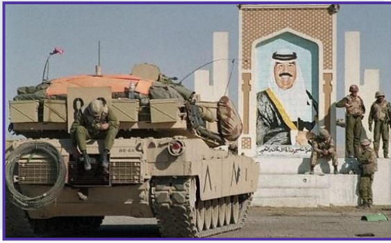
الغزو الأميركي للعراق سنة 2003

وشكلت محاولة لعب دور الوسيط بين دول عربية و"إسرائيل" أولى محاولات التكيف التركي مع البيئة المعقدة التي أشرنا لها في الشرق الأوسط، ويشير تاريخ العلاقات الدولية إلى أن الدولة التي تسعى للعب دور الوسيط في النزاعات الدولية لا بدّ لها أن تحظى بقبول الطرفين لهذا الدور، وهو أمر لا يتم دون أن تكون العلاقة بين الوسيط من ناحية وطرفي النزاع من ناحية ثانية علاقة إيجابية.