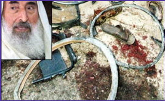
اغتيال الشيخ أحمد ياسين 2004

بين الدولتين، وبعد ذلك بشهرين وجهت تركيا انتقاداً حاداً لعملية اغتيال "إسرائيل" لزعيم حركة حماس الشيخ أحمد ياسين، ووصفها رئيس الوزراء التركي في حينها رجب طيب أردوغان