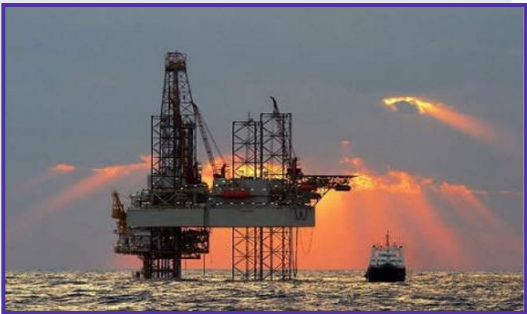
اكتشاف حقول النفط في البحر المتوسط

نتيجة لاكتشاف "إسرائيل" حقول غاز كبيرة في البحر المتوسط يفيض عن حاجتها، بدأت البحث عن زبائن لها في الجوار القريب، فوَقَّعت اتفاقاً مع الأردن، لكنها أدركت أن السوق الأردني صغير في حجم حاجته، ثم جرت محاولات مع مصر، ثم تعثرت هذه المحاولات