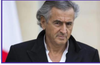
برنارد هنري ليفي

في "المشاركة مع الأردن وغيرها لرعاية الأماكن الإسلامية المقدسة في القدس" ما يعزز هذا الرأي. 13 وتزداد مؤشرات تأثير النزعة الدينية في فهم السلوك السياسي التركي في اتهام