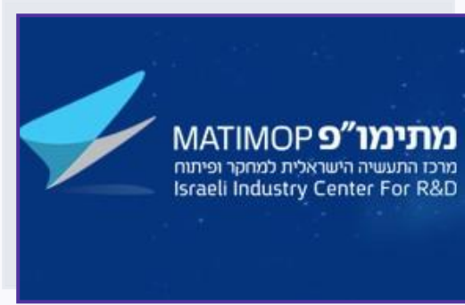
المركز الصناعي الإسرائيلي للبحث والتنمية

على الرغم من التوتر السياسي في فترة 2006-2010، فإن التعاون بين الأكاديميين من ناحية وبين بعض الهيئات العلمية من الطرفين التركي والإسرائيلي لم ينقطع خصوصاً في مجالات محددة مثل الهندسة الطبية. كما تزايد التعاون بين مؤسسات علمية من الطرفين معنية بالتعاون العلمي مثل المجلس التركي للبحث العلمي والتقني The Scientific and Technological Research Council of Turkey (TÜBİTAK)، والمركز الصناعي الإسرائيلي للبحث والتنمية Israeli Industrial Center for Research and Development (MATIMOP). 30