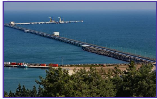
ميناء جيهان التركي