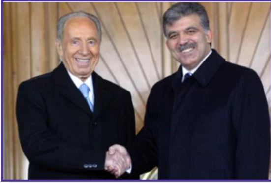
لقاء شيمون بيريز مع عبد الله غول 2007

بالمقابل، فقد قام أردوغان (كان رئيساً للوزراء حينها) في أيار/ مايو 2005 بزيارة "إسرائيل" عارضاً دور الوسيط خصوصاً مع سورية، وهي السنة نفسها التي اشترت فيها تركيا