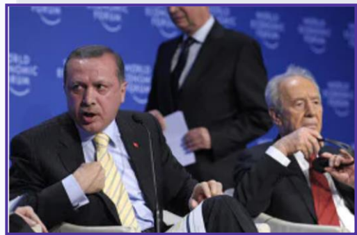
الرئيس رجب طيب أردوغان في دافوس

الإسرائيلية بعد العدوان الإسرائيلي على غزة سنة 2008، والانتقاد التركي الحاد للسلوك الإسرائيلي والذي عبّر عنه أردوغان في منتدى دافوس Davos Forum سنة 2009. وتزايد التوتر بعد أن منعت تركيا "إسرائيل" من المشاركة في تدريبات نسر الأناضول العسكرية Anatolian Eagle في تشرين الأول/ أكتوبر 2009، والتي جرت في إطار