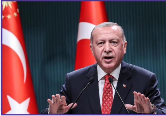
رجب طيب أردوغان

المنطقة، والعمل على إحيائه. ويضيف هذا التيار أن العلاقات التركية الإسرائيلية بقيت مستقرة، بل إن العلاقات التجارية جعلت من تركيا الشريك التجاري والسياحي الأول لـ"إسرائيل" في الشرق الأوسط، ناهيك عن وجود مسافة فاصلة تضيق وتتسع بين الحين والآخر بين تركيا وتنظيمات محور المقاومة كحزب الله، بل وأحياناً مع الجهاد الإسلامي والجبهة الشعبية لتحرير فلسطين، إلى جانب مسافة فاصلة نسبياً مع إيران التي يرى هذا التيار فيها سنداً مركزياً لمحور المقاومة الذي لا يروق له استمرار العلاقات الدبلوماسية الكاملة بين تركيا و"إسرائيل"، لا سيما أن تركيا هي أول دول إسلامية اعترفت بـ"إسرائيل" منذ نشوئها، وفي ظلّ تيار سياسي تركي حاكم يختلف تماماً في توجهاته عن توجهات حزب العدالة والتنمية الحاكم حالياً في تركيا، لكن