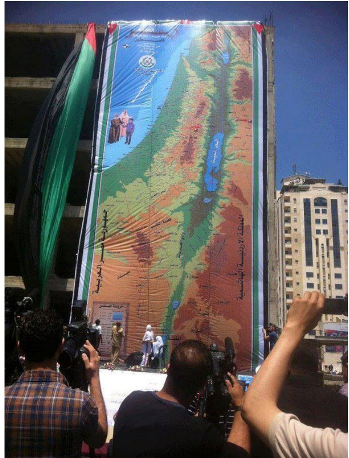
قطاع غزة: رفع الستار عن أكبر خريطة لفلسطين في العالم دنيا الوطن، 2012/4/9